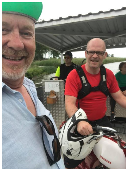
Glada Hemfjärden runt-mopedister